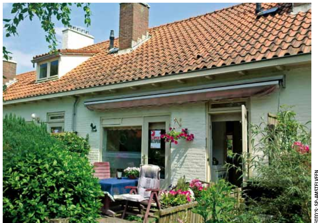
Met de klok mee: SP-actie 'Armoede Werkt Niet'; SP-team geeft voorlichting over plannen lijn 5 en 51; fractievoorzitter Joep van Erp blijft plakken voor 'Armoede Werkt Niet'; voor het raam een SP-poster voor behoud huizen Jan Lievensweg.