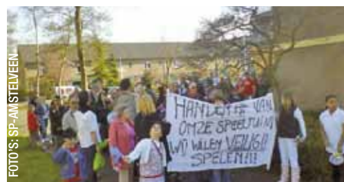
De SP samen met ouders in kinderen in actie eerder dit jaar voor behoud van de speeltuin.